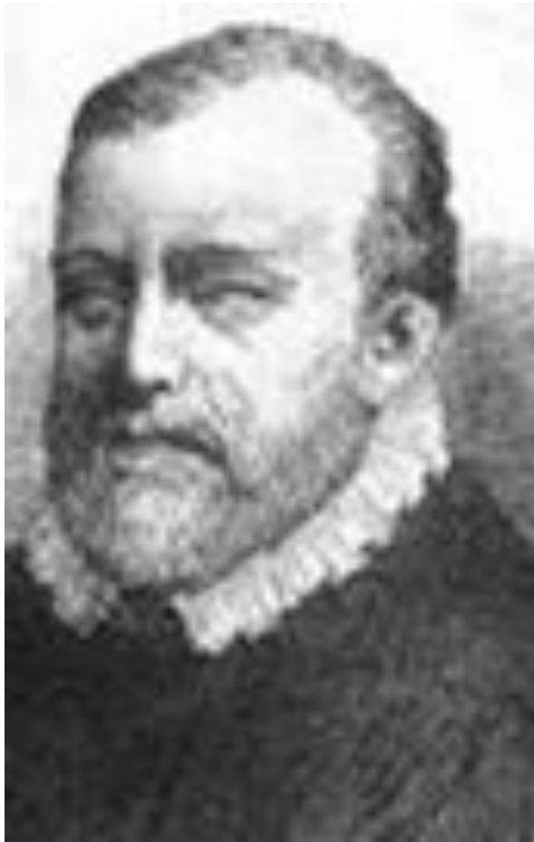
Франсиско де Салинас